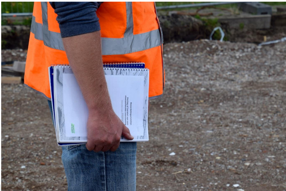
Foto: Toepassen BRL in praktijk

De aannemer mag aan één persoon meerdere functies toekennen.